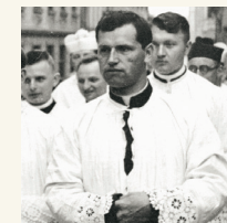
Číhošťský farář Josef Toufar zemřel 25. 2. 1950 na následky brutálních výslechnů Státní bezpečnosti