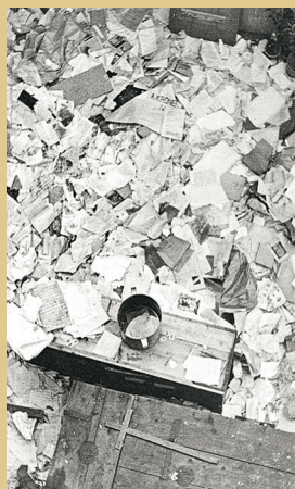
Útok proti klášterům znamenal rovněž nevratné kulturní ztráty (klášter Kadaň, 1950)

Jeho součástí byla násilná izolace biskupského sboru od věřících, uvěznění či internace biskupů, přerušení diplomatických styků s Vatikánem a politické monstrprocesy. V prvním z nich byli souzeni představitelé mužských řeholí a katoličtí teologové a byl doprovázený propagandistickou kampaní