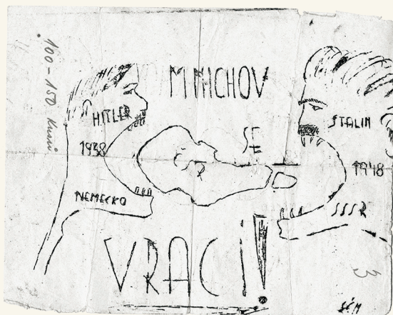
Ilegální leták zabavený Státní bezpečností (ABS)

Dějiny 20. století přinesly nejen rozvinutí mnoha vymožeností moderní civilizace, ale také opakovaně ohrožení základních lidských práv a hodnot. Zvláště destruktivně v celosvětovém měřítku se přitom projevil nacismus a komunismus jako politická hnutí a režimy zaměřené systematicky na duchovní podrobení jedince. Přitom se ukázalo, že po likvidaci demokracie a občanských práv přišly zejména za vlády komunistů na řadu v rámci manipulace s lidmi tradiční základní hodnoty spojené s křesťanstvím. Totalitní režimy si kladly za cíl proniknout – obrazně řečeno – až do duše obyvatel a prosadit tím definitivně svou despotii.